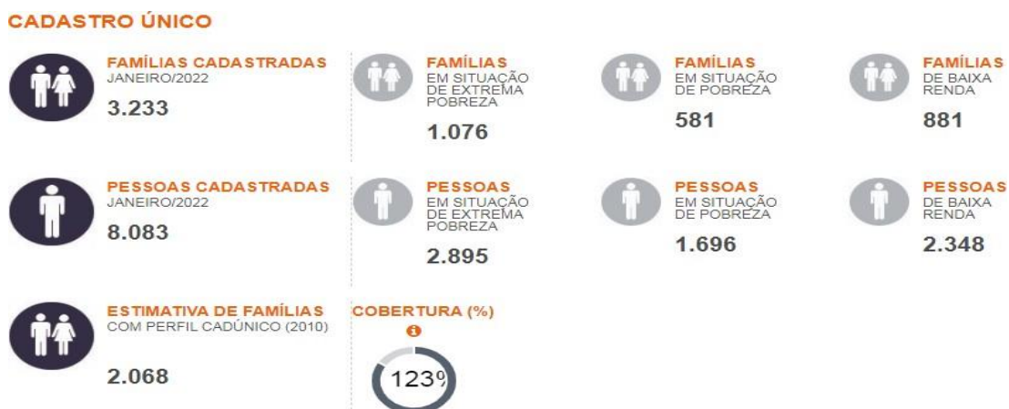
Figura 03

Os dados do cadastro único podem ser visualizados na Figura 3: