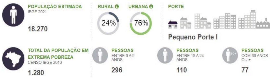
Figura 01

Certamente, tais dados encontram-se defasados e já não expressam mais a realidade do município, tendo em vista o dinamismo das relações sociais e as transformações sociais, culturais, econômicas e políticas que ocorreram nesses últimos 12 anos. Todavia, precisamos tê-los como referência para subsidiar a elaboração do presente Plano Municipal de Assistência Social.