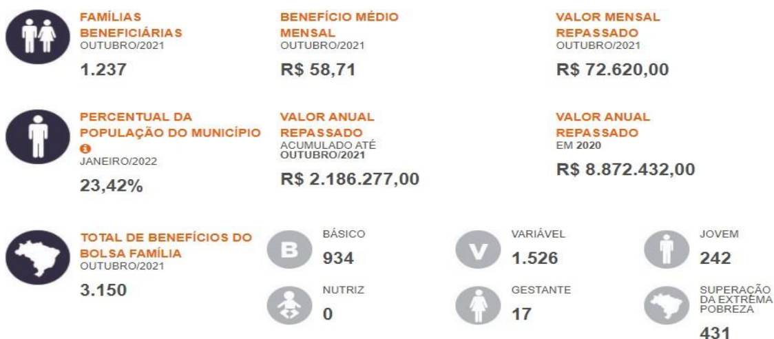
Figura 04 - Fonte: https://aplicacoes.mds.gov.br/sagi/ri/relatorios/cidadania/?codigo=330540&aM=0#auxiliobrasil

O sistema de condicionalidades – SICON do PBF, que acompanha as famílias em descumprimento de condicionalidades relacionadas à frequência escolar e acompanhamento de saúde está paralisado desde 2020, em razão da pandemia de COVID 19. Os dados mais recentes datam de 2019, como podemos observar na Figura 05.